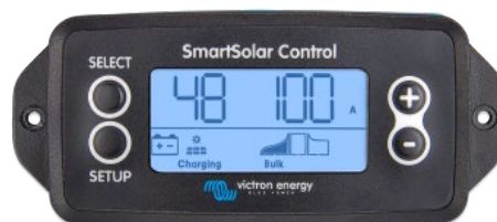
SmartSolar einsteckbares Display