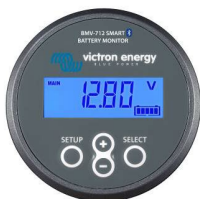
Bluetooth-Sensorik: BMV-712 Smart Batteriewächter