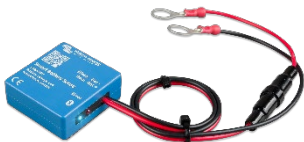
Bluetooth-Sensorik: Smart Battery Sense